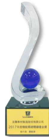
納智捷 總體績優金獎