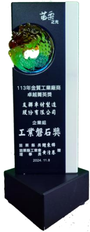
苗栗縣113年 工業磐石獎