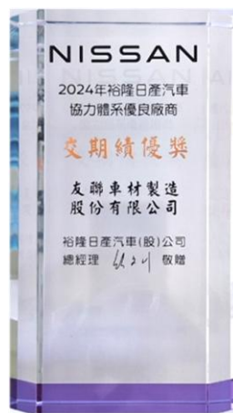
裕隆日產 交期績優獎