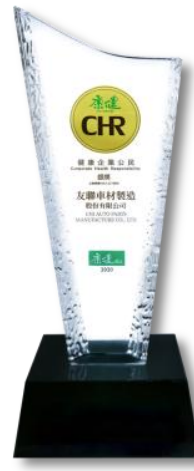
第2屆康健CHR 健康企業公民獎