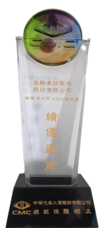
中華汽車 年度績優廠商獎