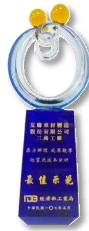
經濟部工業局 MFCFA最佳示範