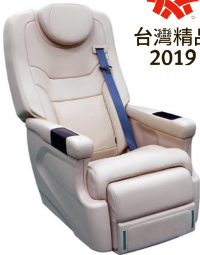
友聯奧圖曼商務抬腿座椅 榮獲2019台灣精品獎