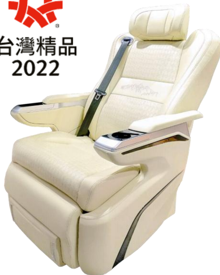
SeatUNI液晶觸控電動豪華椅 榮獲2022台灣精品獎