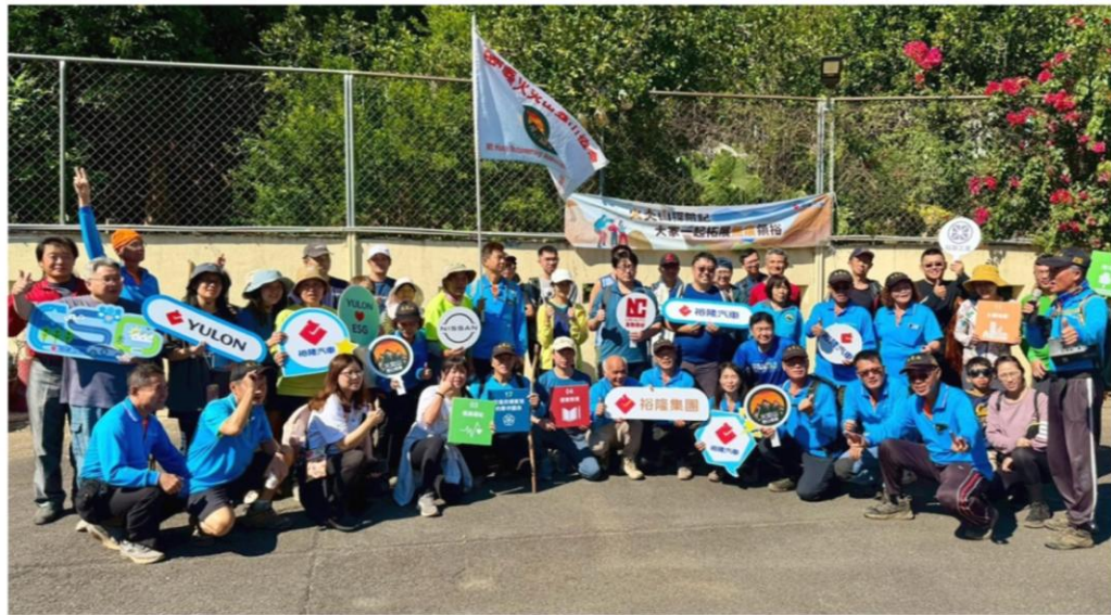
友聯持續參與ESG環境永續活動