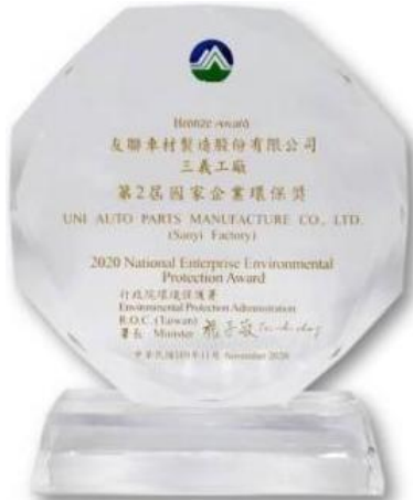
環保署第2屆 國家企業環保獎