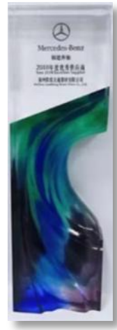
福建奔馳(BENZ) 年度供應商金獎