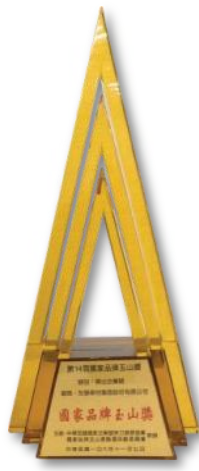
第14屆 國家品牌玉山獎