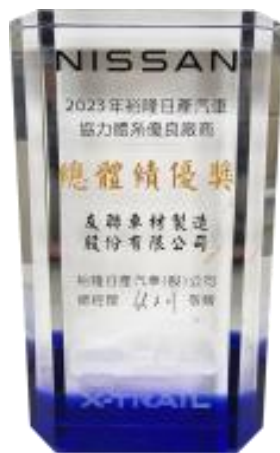
裕隆日產 總體績優獎