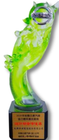
裕隆日產 設計開發績優獎