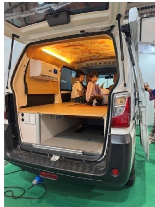
2025戶外用品展-GreenHeaven露營車